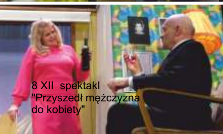
8 XII spektakl "Przyszedł mężczyzna do kobiety"