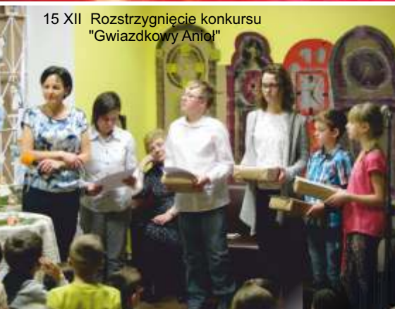
15 XII Rozstrzygnięcie konkursu "Gwiazdkowy Anioł"