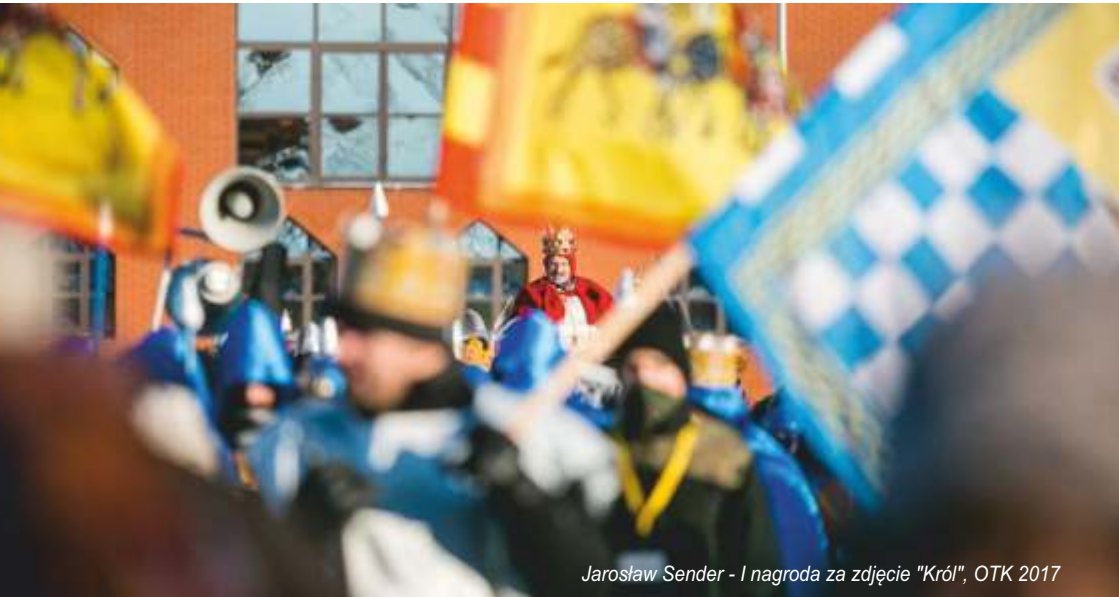
Jarosław Sender - I nagroda za zdjęcie "Król", OTK 2017

Przez cały styczeń w Galerii Ostrołęka można oglądać wystawę poplenerową CZARNIA 2017.