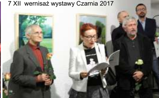
7 XII wernisaż wystawy Czarnia 2017