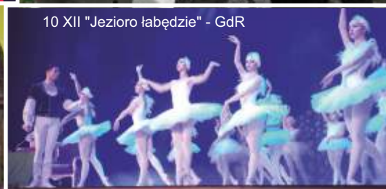
10 XII "Jezioro łabędzie" - GdR