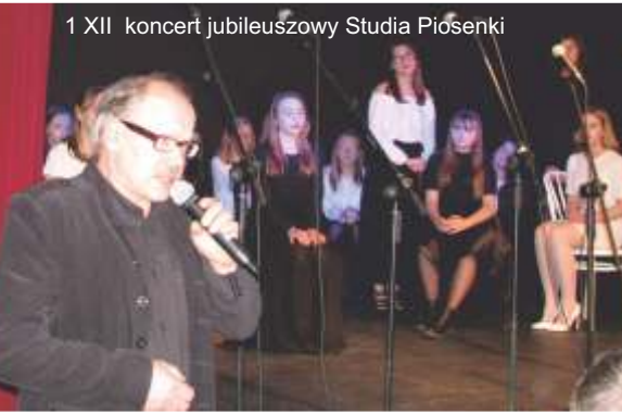
1 XII koncert jubileuszowy Studia Piosenki