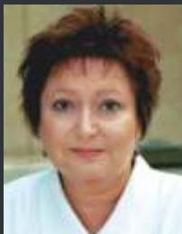
Krystyna Tkacz aktorka